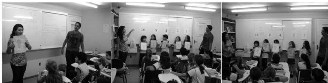
Figura 3 - Aplicação da atividade com os novos cartões

A segunda aplicação desta atividade passou por novas turmas dos mesmos anos letivos. Após a explicação inicial foram escolhidos cinco voluntários. A cada um deles foi entregue um cartão, que representava um bit. As crianças foram dispostas lado a lado e acima de cada uma delas foi posicionado o valor em decimal de cada um dos bits. Usando os cinco bits é possível representar no máximo o número decimal 31, isso porque é necessário somar todas as posições representadas em decimal, são elas: 1, 2, 4, 8 e 16. Caso seja necessário representar um número maior que 31, é necessário incluir outro bit. A Figura 3 abaixo mostra o momento da aplicação com uma das turmas.