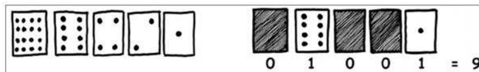
Figura 1 - Cartões da atividade Contando os pontos

Uma turma do 4º, 5º e 9º ano foi utilizada neste primeiro momento. A atividade original propunha o uso de cartões contendo pontos para representar os bits e os seus valores. Foi dito que, ao ligar um bit, os valores relacionados à sua posição eram utilizados para representar os números no sistema decimal. A Figura 1 ilustra os cartões propostos. Cada cartão representa um bit que possui um valor próprio, o primeiro bit (da direita para a esquerda) tem valor um, o segundo valor dois, o terceiro quatro e assim sucessivamente, sendo que o próximo bit terá sempre o dobro do seu antecessor.