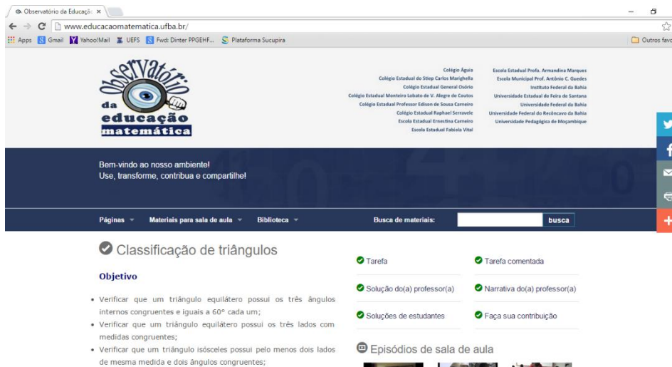
Figura 3 - Página do ambiente virtual do OEM-BA